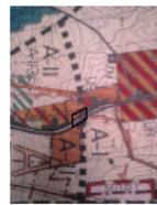
Tereny ochrony środowiska - planu